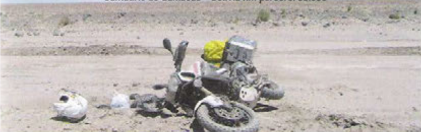
Santuario de Quillacas - Bolivia km percorsi 63.000